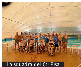
La squadra del Csi Pisa

una grande vittoria per il gruppo dei dirigenti e degli atleti che hanno voluto, con forza, creare per il territorio pisano una ulteriore opportunità di vivere lo sport a 360 gradi, a