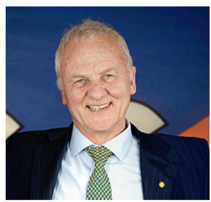
di Vittorio Bosio